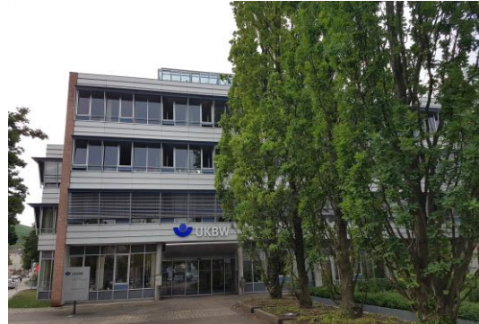
UKBW – Hauptsitz Stuttgart