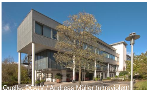
HGU – Campus in Bad Hersfeld

An den beiden Standorten lernt man an gut ausgestatteten Akademien vor allem den Umgang mit den Gesetzen. Die Studierenden sind internatsmäßig untergebracht, werden verköstigt – und haben den Kopf frei fürs Lernen.