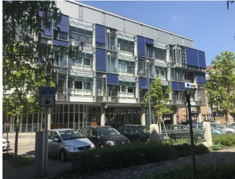
UKBW – Standort Karlsruhe

Während der Praktikumsphasen in Stuttgart oder Karlsruhe lernen die Studierenden durch einen abwechslungsreichen Einsatz die verschiedenen Organisationseinheiten der UKBW und deren Aufgaben kennen. Hier werden sie aktiv in die Arbeit mit eingebunden und dabei durch erfahrene Kolleginnen und Kollegen individuell begleitet und unterstützt.