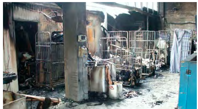
Abb. 3 Brandgeschehen/Textilbrände

Eine Vorsortierung der Hotelwäsche bereits beim und durch den Kunden würde der Brandgefahr entgegenwirken und wäre zur gezielten und speziellen Behandlung der Wäsche äußerst hilfreich.