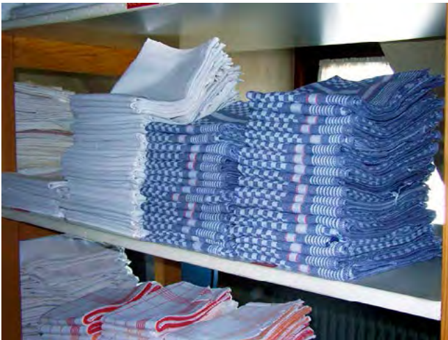
Abb. 1 Gestapelte Wäsche im Wäschelager

Textilbrände durch Selbstentzündung von Wäschestapeln oder von Wäsche im Trockner sind mehrmals im Hotel und Gastgewerbe vorgekommen. Verantwortlich für die Selbstentzündung sind Rückstände von ungesättigten Fettsäuren in den gewaschenen Textilien. Unter bestimmten Voraussetzungen kann es zur Selbsterwärmung bis hin zur Selbstentzündung dieser Textilien kommen, wenn direkt nach dem Trocknen im Trockner bzw. nach dem Heißmangeln die noch warmen Wäschestücke übereinander gestapelt oder verpackt werden.