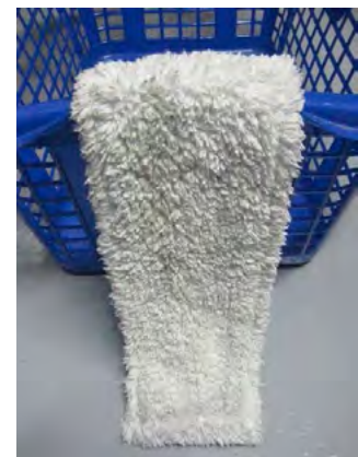
Abb. 2 Wischmop

In zwei Brandfällen waren eindeutig fettverschmutzte Wischmops die Ursache für umfangreiche Evakuierungsmaßnahmen in einem Klinikzentrum sowie in einem Universitätsversorgungszentrum. Es entstand ein Sachschaden in Millionenhöhe.